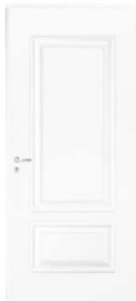
VUE INTÉRIEURE Bicoloration en option